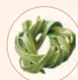
ФЕТТУЧИНИ СО ШПИНАТОМ