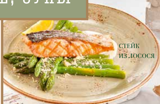
СТЕЙК ИЗ ЛОСОСЯ