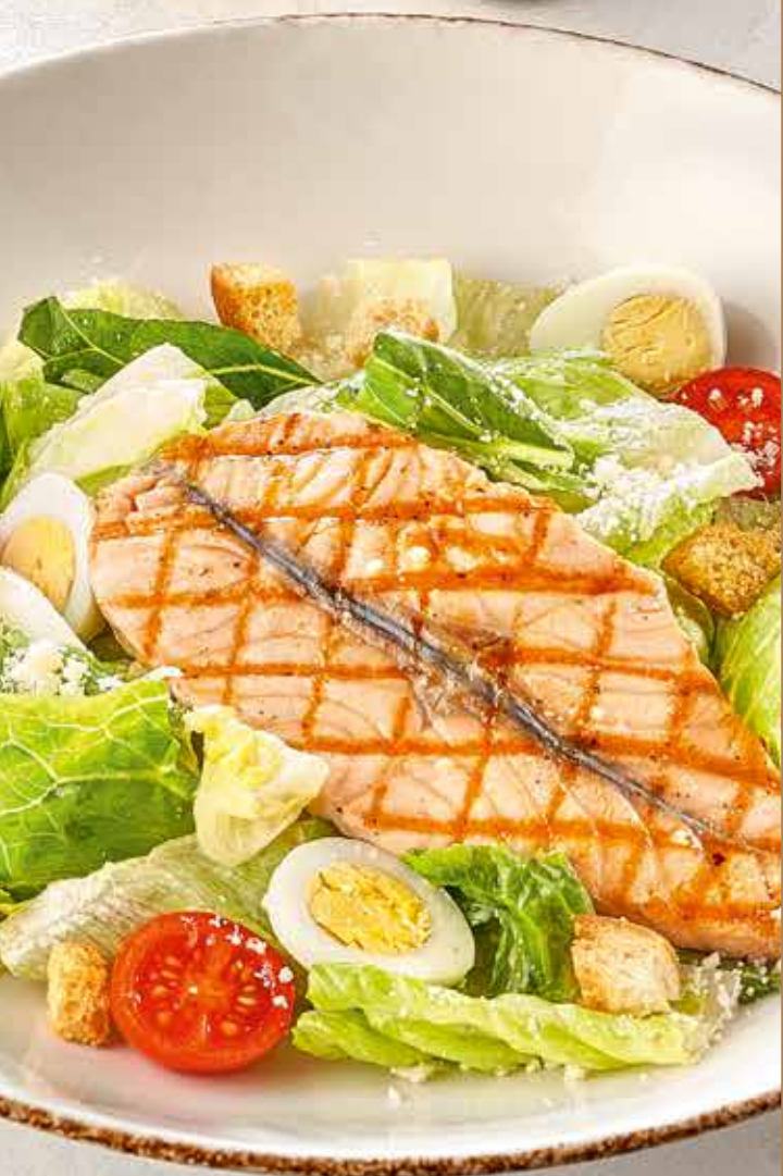
ЦЕЗАРЬ С ЛОСОСЕМ